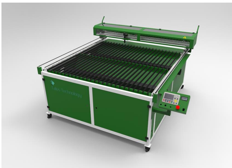
Рис. 2.1 Лазерный станок ТТ 1600*1600